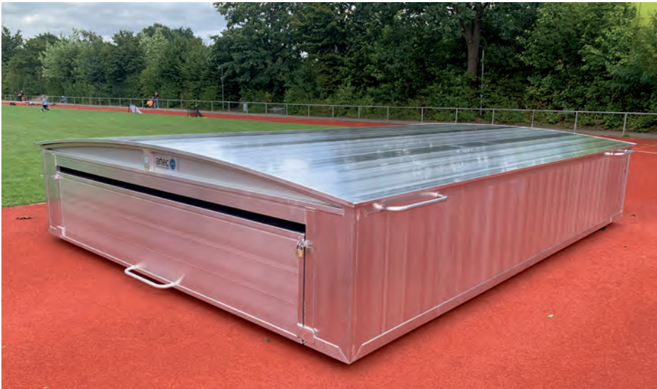
Die neue Hochsprunganlage - gut geschützt durch einen einteiligen Kasten

Nachdem die Anlieferung der neuen Hochsprunganlage um einige Wochen verschoben werden musste, konnte die Leichtathletiksparte sie am 22. August endlich in Empfang nehmen.