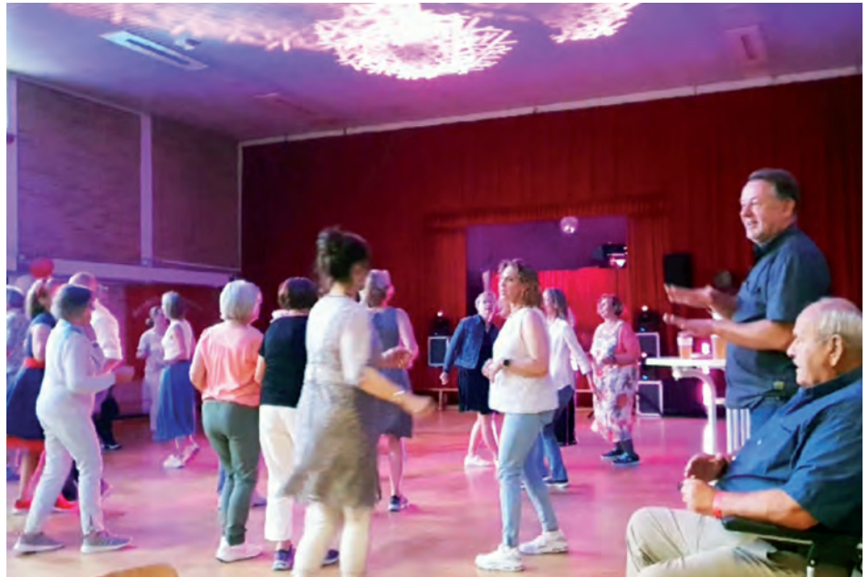
Ausgelassen tanzen in bequemen Turnschuhe - das kam gut an

Auch in der Mehrzweckhalle der Kirsten-Boie Grundschule am Soltausredder herrschte bereits am Vormittag des 6. Juli reges Treiben.