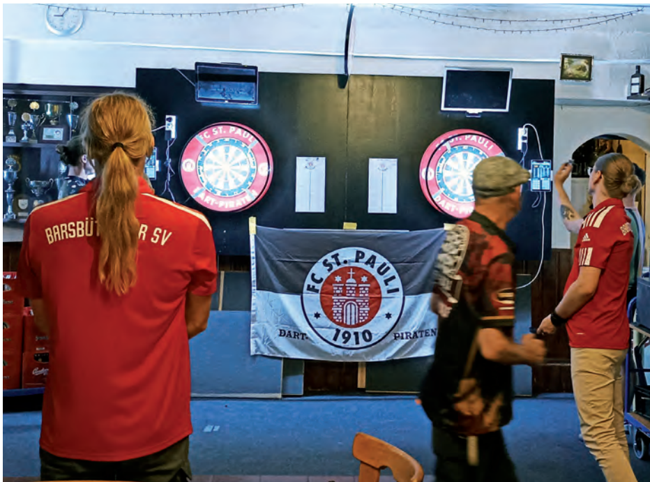
Das BSV-Team beim ersten Auswärtsspiel

Erst vor knapp 7 Monaten haben wir die Sparte SteelDarts im BSV offiziell gegründet und schon spielen wir mit einer noch „kleinen“ Mannschaft in der Bezirksliga in Hamburg. Der Hamburger Dartverband (ldvh.de) hat uns freudig aufgenommen und die Saison hat bereits Anfang September begonnen. Der Spieltag ist immer dienstags mit