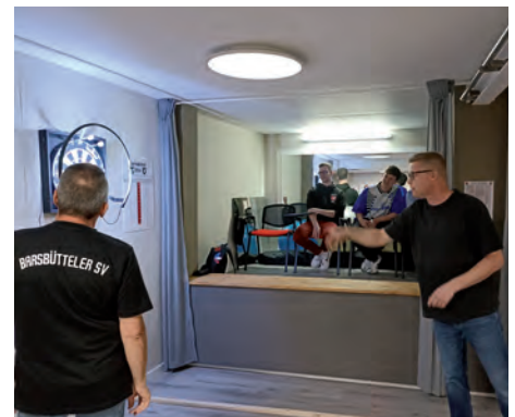
„Dartsbüttel“ im BSV Vereinsheim