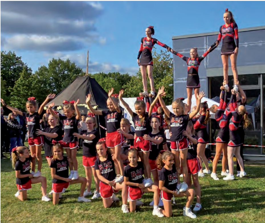
Die BSV Swans Cheerleader mit beiden Teams beim Sommerfest

Am 14. September gab es in Barsbüttel gleich zwei Gründe zu feiern: Das Sommerfest der Vereine und Verbände sowie das 50-jährige Gemeindejubiläum. Bei schönstem Wetter wurde das Gelände der Erich Kästner Gemeinschaftsschule zum lebendigen Festplatz und lockte viele Besucher aus Barsbüttel an.