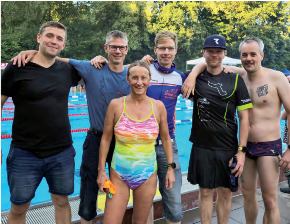
Platz 6 für die BSV Triathlon-Sparte beim 12 Stunden Schwimmen in Trittau

Die Triathlon-Sparte des BSV absolvierte am 20.07.2024 erfolgreich das 12 Stunden Teamschwimmen im Freibad Trittau. Die Motivation war hoch, die Taktik besprochen, und für Verpflegung war bestens gesorgt. Pünktlich um 8 Uhr ging es mit einem Feuerwerk auf die erste Bahn. Mit 6 Teilnehmer*innen haben wir die Herausforderung in 12 Stunden möglichst viele Bahnen zu schwimmen angenommen. Angetrieben vom DJ und Live Bands, war es nicht nur eine sportliche Herausforderung, sondern auch eine große Party. Am Ende sind wir 32.100 Meter geschwommen und konnten damit den 6. von 12 Plätzen belegen. Die Pokale und Urkunden wurden von Deutschlands Schwimmlegende Sandra Völker überreicht, ein emotionaler und bewegender Moment für uns alle!