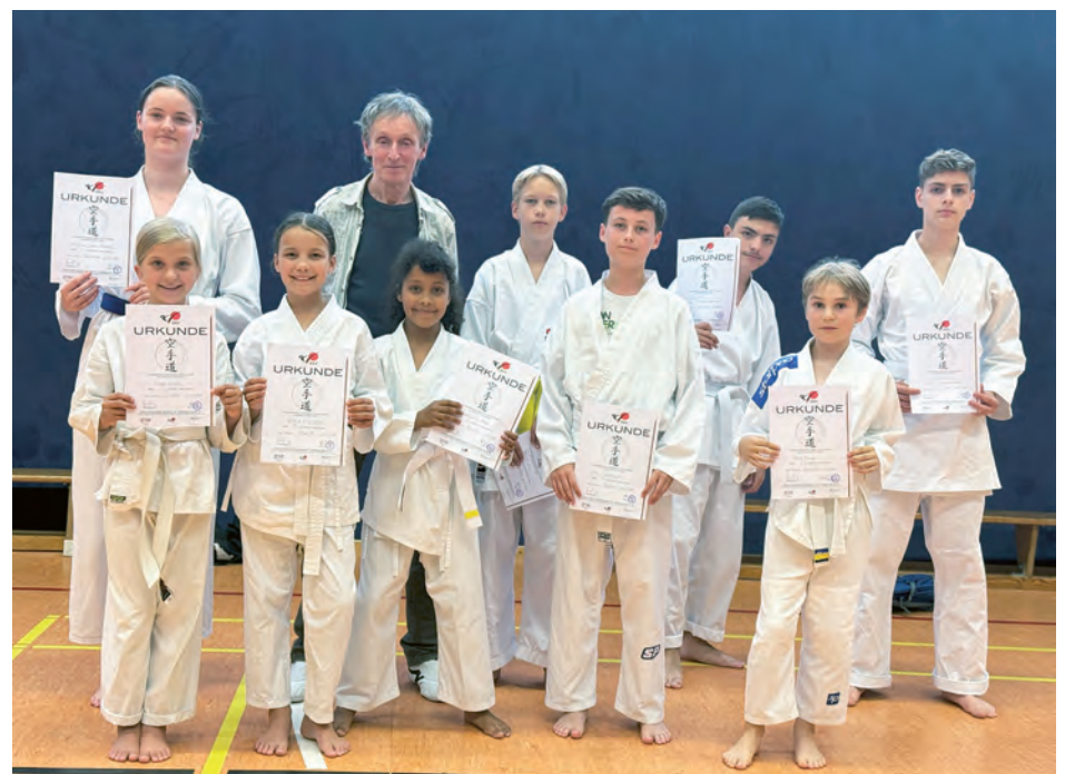
Stolze BSV Sportler nach bestandener Kyu-Prüfung am 12. Juli 2024

Wer diesen vielfältigen Sport gern kennenlernen möchte, darf gern an einem Probetraining teilnehmen. Kinder ab 6 Jahren sind ebenso willkommen, wie erwachsene Sportler.