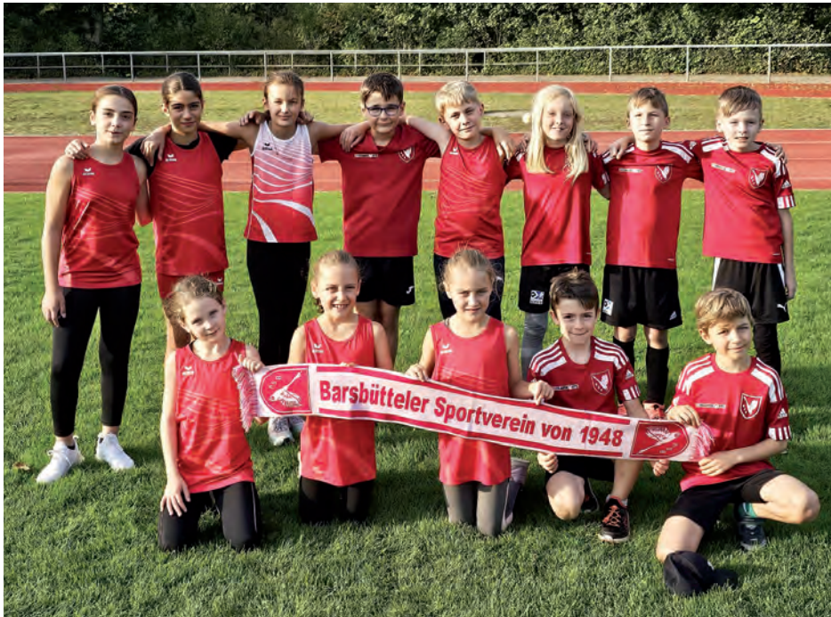
Erfolgreiche BSV-Athleten beim Nachwuchssportfest in Barsbüttel